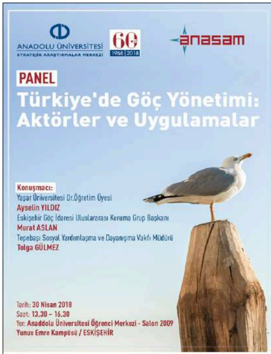
"Türkiye'de Göç Yönetimi" Paneli Anadolu Üniversitesi