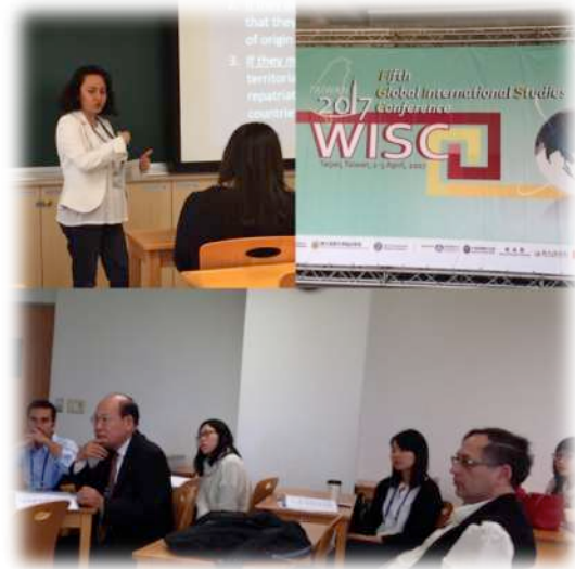
Türkiye-AB İlişkilerinde Göç (Uluslararası Konferans, Tayvan)