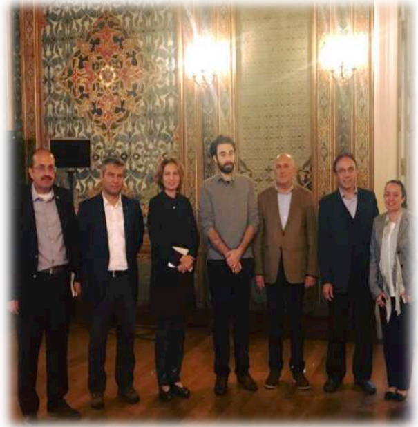
"Migration Trends in the Mediterranean and Regional Policy Responses" Semineri, İstanbul Üniversitesi