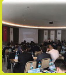
Göçmen kaçakçılığı ile mücadele eğitimleri