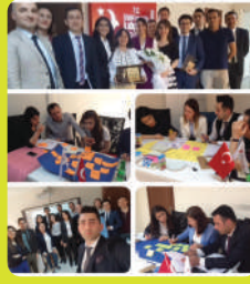
Proje Yönetimi Eğitimi (İzmir İl Göç İdaresi)