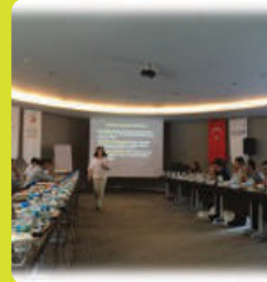
Kültürlerarası iletişim eğitimleri